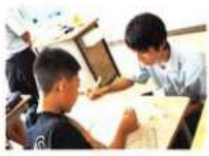
小学校サマースクール